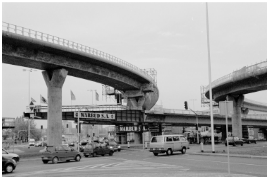
Prowadzenie prac budowa Trasy Siekierkowskiej pomimo wyroku NSA o cofnięciu pozwolenia na budowę, Warszawa