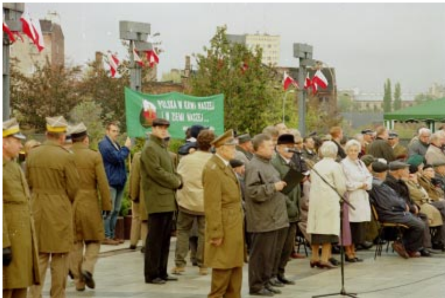
Uroczystości z okazji sześćdziesiątej rocznicy bitwy pod Lenino, Warszawa 11.10.2003