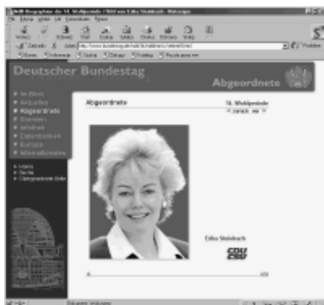
Zdjęcie dolne: Erika Steinbach – przewodnicząca Związku Wypędzonych, posłanka parlamentu Niemiec

ry pod listkiem figowym ONZ. Robi to w wyniku protestów niemieckich przemysłowców, którzy bardzo oplakiwali stracone zamówienia amerykańskie w niemieckim przemyśle. Najważniejsze, żeby "polskie" elity popierały bez zastrzeżeń opcję amerykańsko-izraelską, niemiecką na drugim planie. Trzeba zresztą przyznać, że Schroeder, tak jak i jego minister Joschka Fischer oficjal-