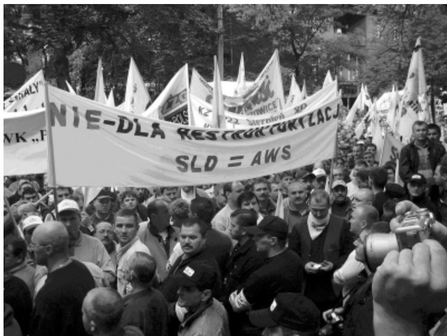
Demonstracja górników w Katowicach, przeciwko likwidacji kopalń, 9 września 2003