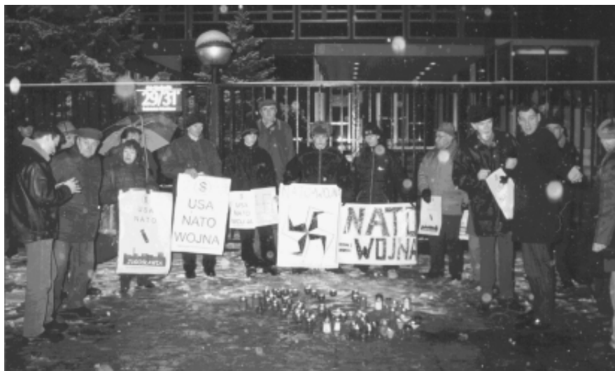
Pikieta Ogólnopolskiego Komitetu Antywojennego przed Ambasadą USA w Warszawie, marzec 2002

Ogólnopolski Komitet Antywojenny stanowczo potępia uczestnictwo naszego kraju w haniebnej awanturze irackiej. Polska ma w swych tradycjach walkę wyzwolenczą o wolność swojego i innych narodów, ale nie ich zbrojne zniewolenie i okupację. Polscy żołnierze nie mogą umierać za obce interesy. Dlatego domagamy się jak najszybszego wycofania z Iraku wojsk okupacyjnych, zastępując je tymczasowo stacjonującymi oddziałami ONZ w znacznej mierze pochodzącymi z krajów islamskich.