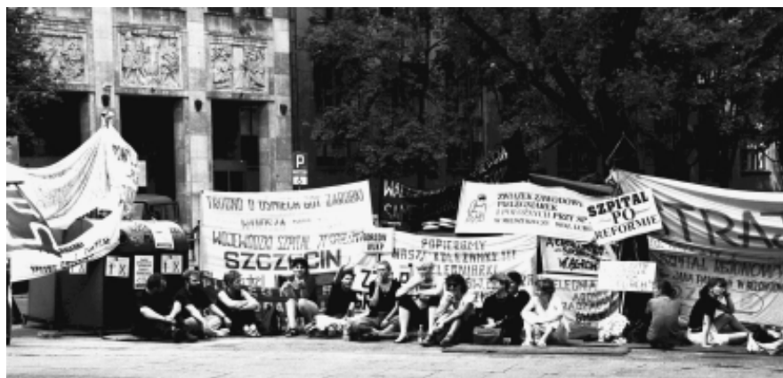
Protesty pielęgniarek i położnych, lipiec 1999